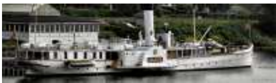
RØDE TALL: Skibladner sliter økonomisk.